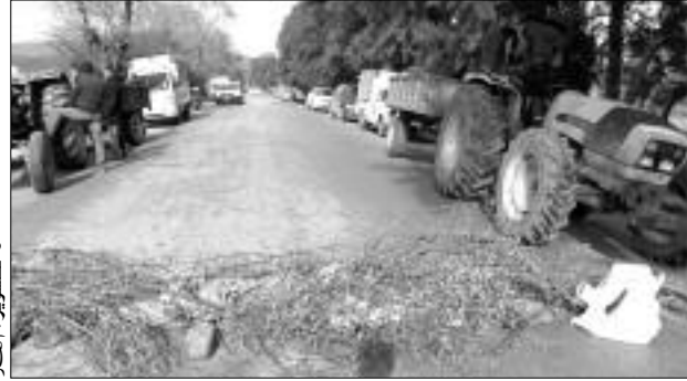
والأغرب من هذا كله يقول السكان إن الصندوق الوطني للتوفير والاحتياط قد باع شركة الترقية العقارية «كتاب إيمو» التي كانت

أقد سكان حي 384 مسكن بطريق الجامعة في قائمة، نهار أول أمس، على غلق الطريق الرئيسي المؤدي إلى حيهم، معبرين عن رفضهم لقيام جهات مجهولة بالاستيلاء على المساحة الخضراء المتواجدة بحيهم لتحويلها إلى عمارات، في الوقت الذي كان يطالب فيه السكان بإنجاز مدرسة ابتدائية لتلاميذ الحي والأحياء المجاورة تجنبهم عناء التنقل للمؤسسات التعليمية البعيدة عنهم، مناشدين الجهات المعنية، وعلى رأسها الجهات القضائية المختصة، ضرورة التدخل العاجل وفتح تحقيق في هذه القضية التي اعتبروا أنه يشوبها الكثير من الغموض.