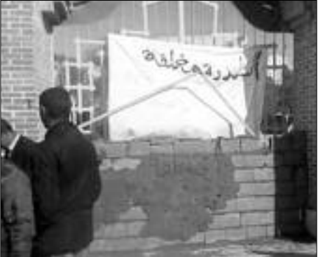
البلدية، وتمسك المحتجين بمطالبهم ومواصلة الاحتجاجات شبه اليومية.