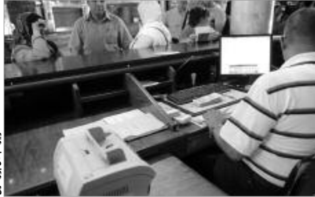
موظف بريد الجزائر يتعامل مع عميل في مكتب البريد.

وأكد ممثل وزارة البريد، أنه ولنفاذي الوقوع في مشكلة نقص السيولة المالية، فإن المؤسسة وضعت برنامجا أسبوعيا لتزويد المكاتب البريدية بالسيولة المالية، لتمكين 22 مليون زبون من سحب أموالهم بأريحية، «لكن عند الحاجة سيتم تزويد