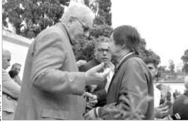
موسى ب. موسى

أصدر قاضي التحقيق العسكري بالمحكمة العسكرية للبلدية، أمس، أوامر بالقبض دولية في حق كل من وزير الدفاع الأسبق، اللواء المتقاعد خالد نزار ونجله لطفى، إلى جانب فريد بن حمدين، صاحب مؤسسة صيد لانية، بتهمة التآمر على الجيش الوطني الشعبي والمساس بالنظام العام.