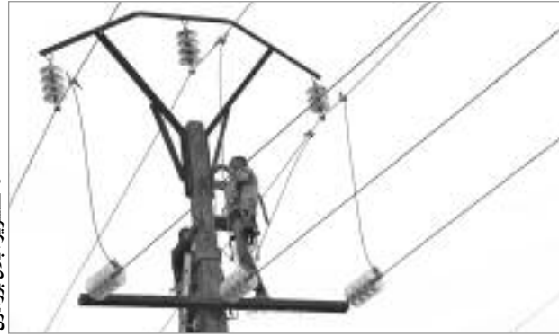
مظاهرات في كرزاز

لازال سكان بلدية كرزاز التي تبعد عن مقر ولاية بشار بـ335، يُطالبون منذ بداية هذه الصائفة، بتدخل المسؤول الأول بالولاية للضغط على مصالح «سونلغاز» من أجل وضع حد لمعاناتهم مع ضعف التيار الكهربائي والانقطاعات، التي باتت متكررة كل ما حل فصل الصيف، وهي الانقطاعات التي لم ترفع أسبابها إلى غاية يومنا هذا، حسب شهادة الكثير من سكان البلدية، الذين أكدوا في اتصالهم بـ«النهار» على أن كل الوعود التي سبق للعديد من القائمين على تسيير مؤسسة «سونلغاز» أن وعدوا بها سكان الدائرة، لم تجسد على أرض الواقع، ذلك أن المؤسسة المذكورة لم تعمل على تغذية شبكة التوزيع بالطاقة الكهربائية الكافية لتغطية حاجة السكان من الكهرباء، خصوصا فصل الصيف، الذي يشهد ارتفاعا