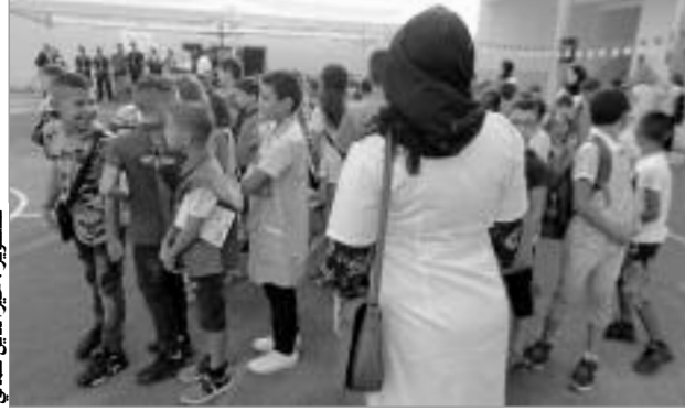
تلاميذ في صفوفهم

وأصدر وزير التربية في الكلمة التي ألقاها في الاجتماع الذي جمعه بمديري التربية الـ 50 الموزعين عبر التراب الوطني، على ضرورة احترام كل التعليمات التوجيهية قصد إنجاح الدخول المدرسي، كما طالبهم بالحرص على العمل من أجل إنجاح الموسم الدراسي. وحسب الأرقام التي قدمها الوزير، فقد بلغ العدد الإجمالي للتلاميذ 9 ملايين و110 ألف، من بينهم 155 ألف تلميذ يلتحقون بالمدرسة لأول مرة. كما كشف أنه سيتم تسليم 656 مؤسسة تربوية، منها 426 مدرسة ابتدائية و137 متوسطة و93 ثانوية، على أن تضاف إليها 161 مؤسسة أخرى مع نهاية السنة الجارية. ولضمان التأطير