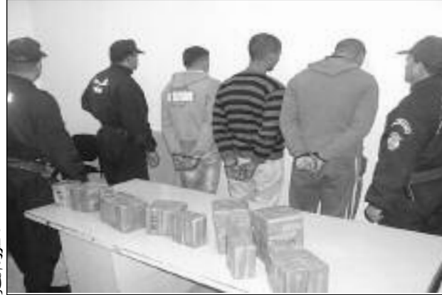
• لقيت القبض