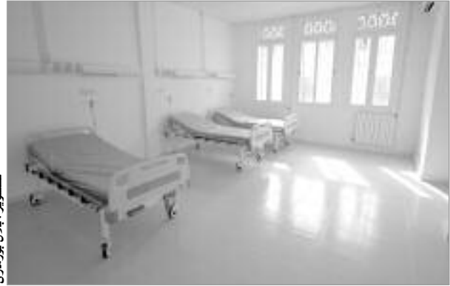
تأخر تسليم المستشفى الجديد ببلدية منداس يؤرق المرضى

وحسب هؤلاء المواطنين في حديثهم إلى «النهار»، فإن هذا المرفق الصحي، الذي أعطيت إشارة انطلاقه، قبل سنوات خلت وعرف نزول كل وزراء الصحة السابقين، ينتظر التفاتة من وزير الصحة الجديد للإسراع في تجهيزه وفتحه، بعدما تجاوزت نسبة تقدم الأشغال 98 من المئة، حسب هؤلاء، مؤكداً أن كل سكان هذه الجهة ببلدياتها الأربع، يأملون في الإسراع بتسليمه لتجنيبهم مشقة التنقل إلى المؤسسات الاستشفائية العمومية الأخرى المتواجدة بالمناطق البعيدة عنهم، سواء بولاياتهم غليزان أو بتلك التابعة لبلدية الرحوية بولاية تيارت المجاورة، مستطردين أن مرضاهم مرغمون على التوجه إلى عاصمة