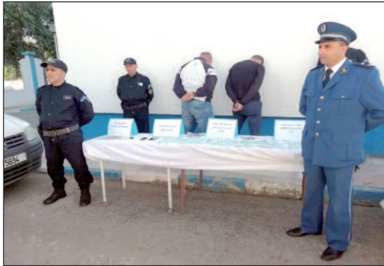
حجز 1541 ورقة نقدية من فئة 2000 دج مزورة أي مبلغ

مالي قدره 3.082.000 دج. إلى ذلك، وحسب مصالح الأمن بالولاية، فإن عناصر الشبكة الموقوفين تم تقديمهم أمام محكمة الجمهورية لدى محكمة أدرار، وبعد إحالة الملف أمام قاضي التحقيق، أمر بإيداع عناصر الشبكة الحبس المؤقت عن قضية تكوين مجموعة أشرار قصد ارتكاب جنائية وإصدار وتوزيع وبيع أوراق نقدية مقلدة ذات سعر قانوني في الإقليم الجزائري.