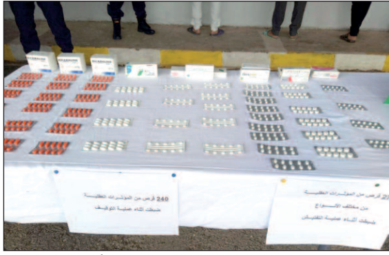
توقيف شخص كان بصدد ترويج كمية معتبرة من المهلوسات، أين تم التحقيق معه والكشف عن هوية شركائه

الذين تم توقيفهم في عمليات أخرى ناجحة، واسترجاع وحجز بعض المؤثرات. هذا وسيتم تقديم الموقوفين بعد تحرير محاضر سماع في حقهم لتقديمتهم أمام الجهات القضائية المختصة إقليميا للنظر في التهم الموجهة إليهم، والمتعلقة أساسا بتكوين مجموعة أشرار وحياسة وترويج المؤثرات العقلية وكذا حيازة وثائق طبية لغرض استغلالها في نشاط غير قانوني.