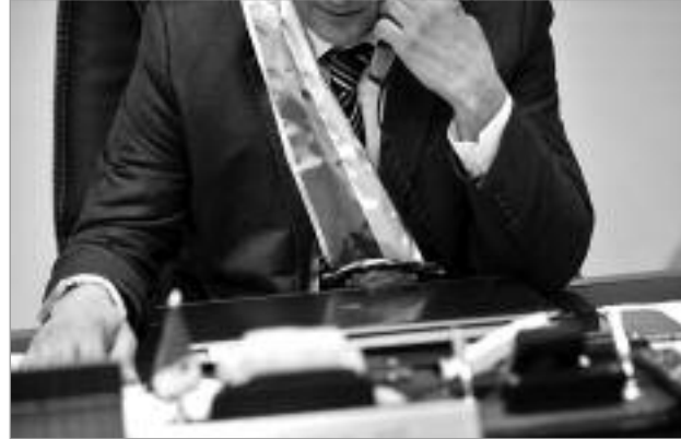
قاضي التحقيق بالبلدية عين البنيان

علمت "النهار" من مصادر موثوقة، أن قاضي التحقيق بمحكمة تيبازة باشر، مؤخراً، تحقيقاته القضائية مع مير بلدية عين البنيان الحالي عن تهمتي سوء استغلال المنصب وعدم التبليغ عن التجاوزات التي ارتكبتها 3 موظفين ببلديته، منهم موظف بمصلحة الحالة المدنية وتنظيم الانتخابات ومكلف بإحصاء المساكن الفوضوية، إلى جانب رصاص وموظف بالمصلحة التقنية، المتهمين بالرشوة، استغلال الوظيفة والتزوير واستعمال المزور في محررات إدارية.