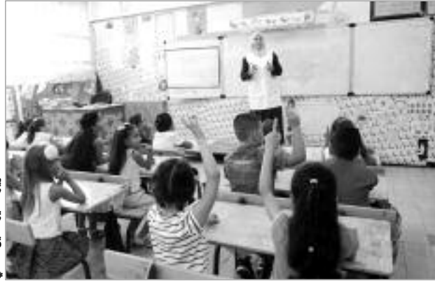
تلاميذ مدرسة الإبتدائية «بن عمر النوي» في تقرت.

وقد جاءت هذه المبادرة النموذجية التي لقيت الكثير من التجاوب والاستحسان من سكان