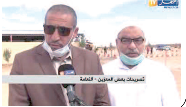
تصريحات بعض المعزين - النعامة

شاركت قناة «النهار» في تشييع جثمان الفقيدة، تبون حليمة، شقيقة الرئيس، عبد المجيد تبون، التي توفيت، أول أمس. وقد نقلت قناة «النهار» تصريحات بعض المعزين الذين تحدثوا عن الخصال الحميدة والنبل للفقيدة، مؤكدين بأنهم فقدوا إنسانة محبة للخير وللجزائر. هذا وقد تم تشييع الجنازة في مقبرة «المربوح» بولاية النعامة.