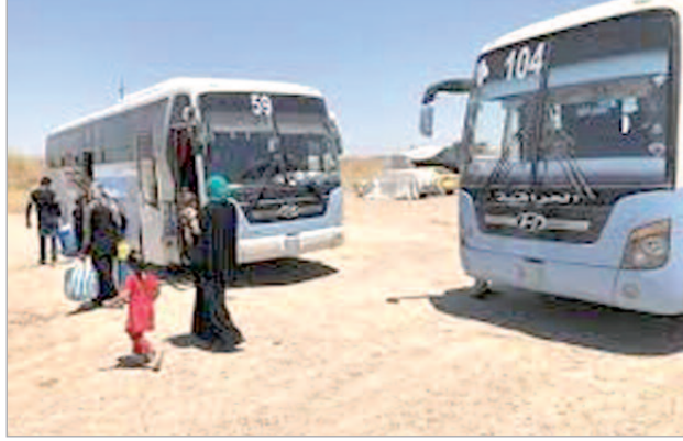
حافلة لنقل المدرسين

وفي كلمته، حذر والي ولاية غليزان، رؤساء هذه البلديات، من سوء التسيير لعتاد الحظائر، خدمة للمصلحة العامة للمواطنين، كما أكد على وجوب الحفاظ على هذه الحافلات الجديدة، من خلال الصيانة المستمرة، مع ترشيد النفقات، بعدما لاحظ خلال عدد من زيارته الميدانية لحظائر بعض البلديات، ومن خلال التقارير التي وصلت مكتبته، نوعا من الإهمال لهذه الحظائر، مستطردا خلال حفل توزيع 28 حافلة جديدة على بلدية نائية، تم اقتناؤها من صندوق الضمان والتضامن للجماعات المحلية، أن هذه الحافلات ستوجه مباشرة لأبناء قاطني «مناطق الظل»، بغية