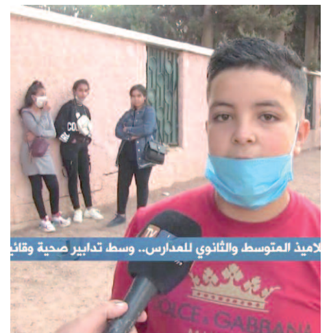
لاميد المتوسط والثانوي للمدارس.. وسط تدابير صحية وقائية