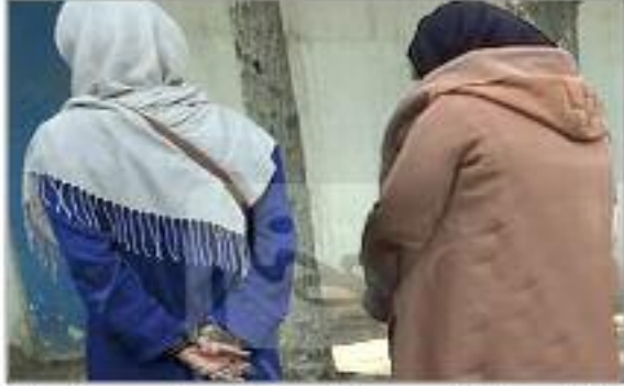
عليها، استعملت فيه ووقتها داهمت العصاية النصابتان عبوة «كريموجان»، النسوية المنزل قبل أن مما تسبب في إغماء الضحية، تغادراه وهما محملتان

بالذهب المسروق، وتم لاحقا تحويل الضحية إلى المستشفى متأثرة بمضاعفات حادة ناتجة عن استنشاق الغاز المسيل للدموع. وترافقت هذه العملية مع عمليات سطو أخرى استهدفت مبالغ مالية وهواتف نقالة ومركبات، بالموازاة مع عودة ظاهرة رشق السيارات بالحجارة والبيض لإجبار سائقها على التوقف قصد سلبهم الغنائم الثمينة التي تكون بحوزتهم.